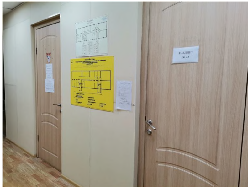
2 этаж, кабинет 24 (для приема посетителей)